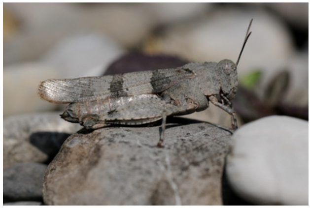
Die Blauflügelige Ödlandschrecke (stark gefährdet)