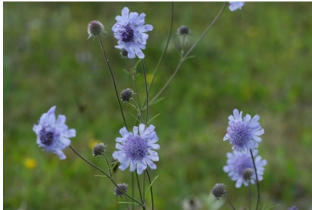
Die graue Skabiose (stark gefährdet)