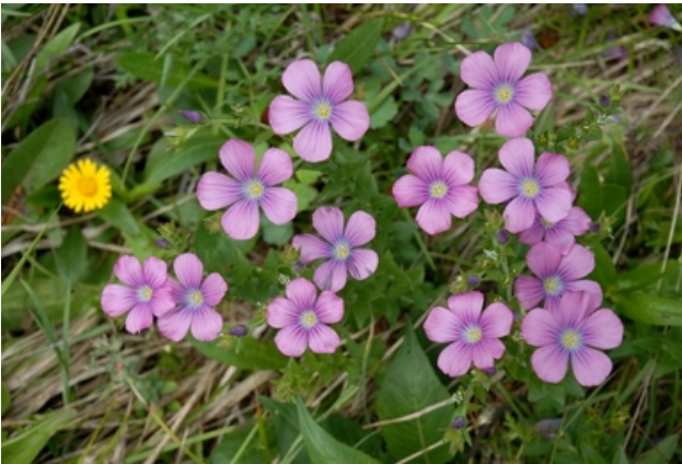
Der klebrige Lein (stark gefährdet)

Hier einige der bedrohten Tier – und Pflanzenarten