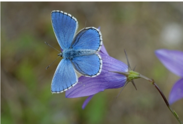
Der Himmelblaue Bläuling (gefährdet)