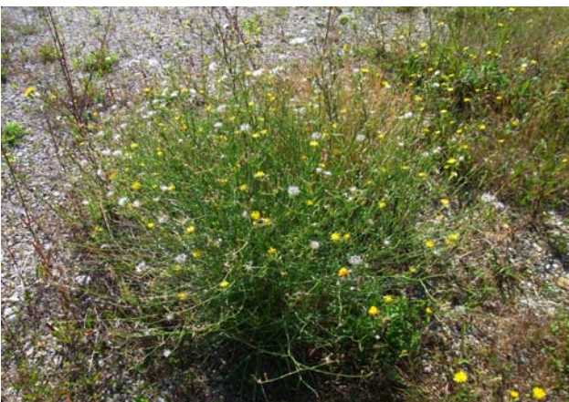
Der große Knorpellattich (stark gefährdet)